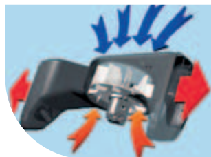
Système de refroidissement